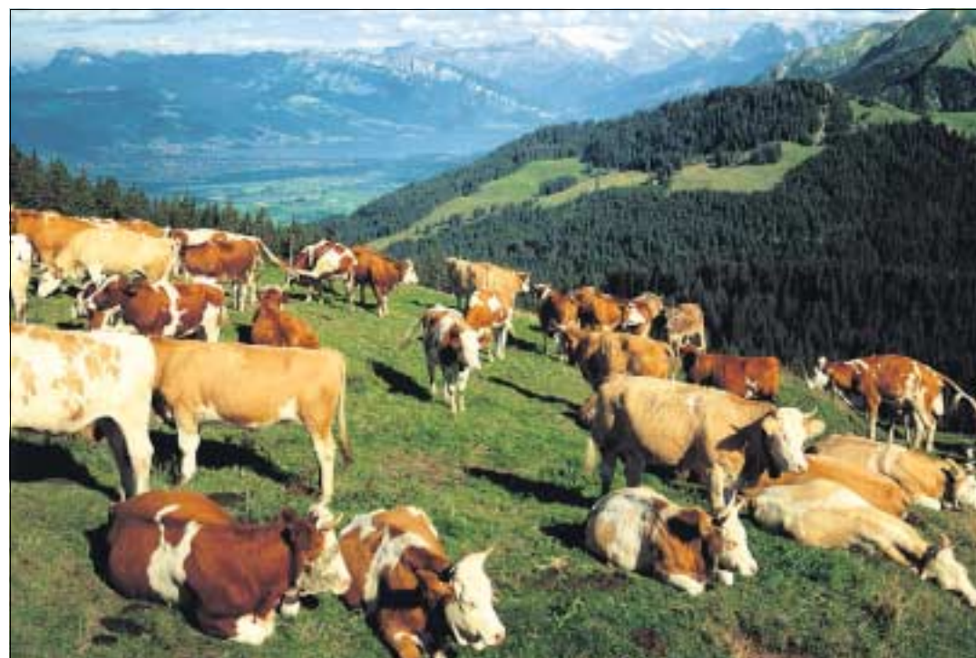
Im nördlichen Gantrischgebiet schaut man von Hügeln auf Berge und trifft allenthalben Kühe an.

Von hier aus geht es neben Einfamilienhäusern vorbei, deren Gärten mit Pinzette und Onduliertab gestaltet scheinen – die perfekte Welt für Gartenzwerge und Geranien. Wir lassen Schwarzenburg hinter uns, das ebenso wohlgeordnete Land folgt auf dem Fuss. Mit dem ersten leichten Anstieg zum Waldrand spürt man die vom Regen gewaschene frische Luft in den Lungen, dazu vernimmt die Nase eine leichte Naturdüngernote mit Einsprengeln von Wald-im-Dunst-Bouquet. Wir fühlen uns wohl und gehen einen asphaltierten Weg entlang. Die Vögel geben wilde Konzerte, auf saftigen Wiesen stehen Kühe mit vom Regen glänzenden Rücken. Ein Muni hinter (hoffentlich geladenem) Draht schreitet selbstbewusst zu den Wanderern, und wie fürs Foto bestellt zeigt sich kurz die Sonne. Da heute Werktag ist, fahren