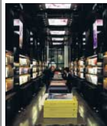
«Taschen»-Laden in Beverly Hills.

vard, liegt strategisch perfekt. Von dort aus kann man die Gegend leicht zu Fuss erkunden. Ultrachic im Mod-Style, gehört das Hotel zu den interessantesten Herbergen, ist aber nichts für Lärmempfindliche. Wer's etwas ruhiger mag, wählt das (11) Crescent , 403 North Crescent Drive. Die Villa von 1926 erhielt ein gut gemachtes Facelift. Simone Ott